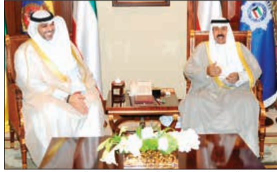
سمو ولي العهد خلال استقباله الشيخ محمد العبد الله