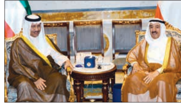
صاحب السمو خلال استقباله سمو رئيس الوزراء الشيخ جابر المبارك