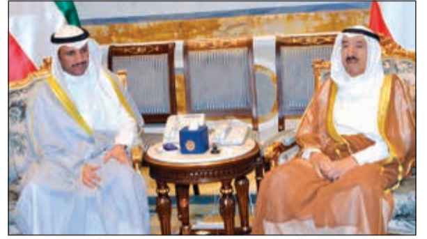
صاحب السمو الأمير الشيخ صباح الاحمد مستقبلا مزروق الغانم