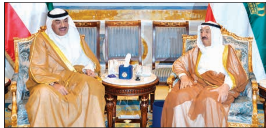
صاحب السمو الأمير مستقبلا الشيخ صباح الخالد

استقبل صاحب السمو الأمير الشيخ صباح الأحمد بقصر بيان صباح امس سمو ولي العهد الشيخ نواف الأحمد. كما استقبل سموه بقصر بيان صباح امس رئيس مجلس الأمة مزروق الغانم. واستقبل سموه سمو رئيس مجلس الوزراء الشيخ جابر المبارك. كما استقبل سموه بقصر بيان صباح امس النائب الأول لرئيس مجلس الوزراء ووزير الخارجية الشيخ صباح الخالد.