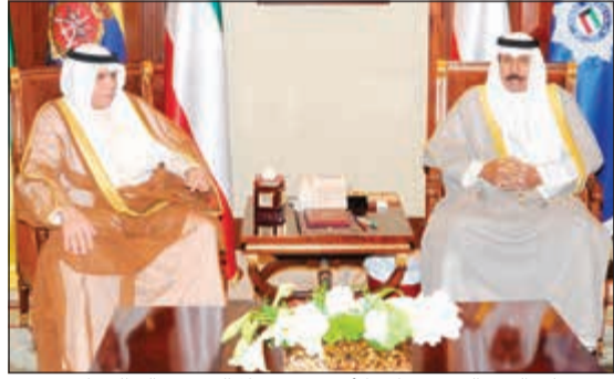
سمو ولي العهد الشيخ نواف الأحمد مستقبلا الشيخ خالد الجراح

الداخلية الشيخ خالد الجراح. كما استقبل سمو ولي العهد وزير الدولة لشؤون مجلس الوزراء ووزير الإعلام بالوكالة الشيخ محمد العبدالله.