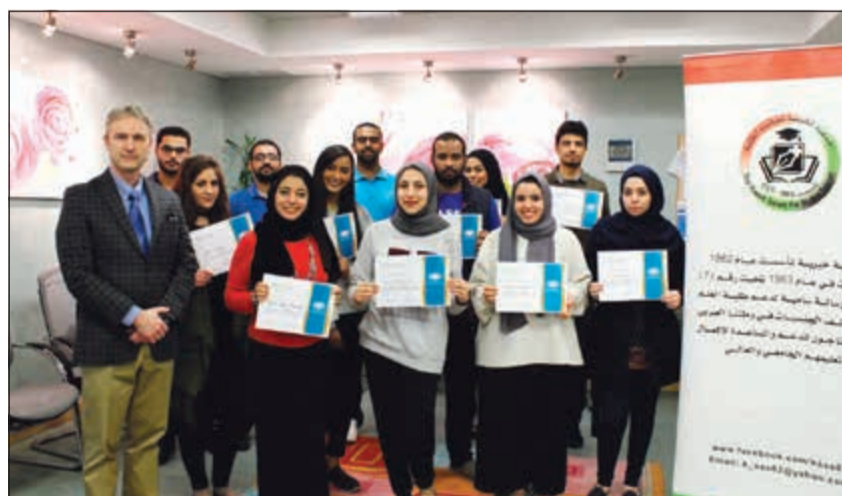
طلبة الدراسات العليا المشاركون في التدريب

أطلقت مؤسسة فوزية السلطان للتأهيل الصحي برنامجاً تدريبياً إكلينيكياً لطلبة الدراسات العليا بهدف تطوير المهارات العملية وتعزيز المعرفة الإكلينيكية لدى الخريجين في التخصصات الطبية والاضطرابات النطق في القطاع الصحي بالكويت.